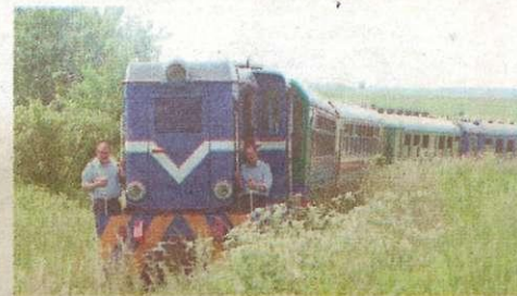
4. Ciuchcia „Express Ponidzie”