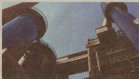
10. Starachowice - Muzeum Przyrody i Techniki