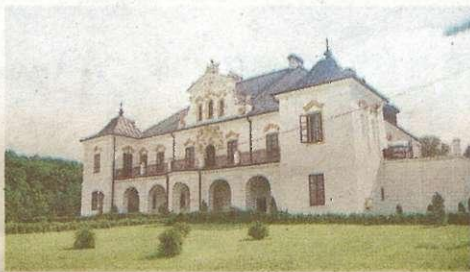
1. Czyżów - pałac szlachecki

Przyrody i Techniki, 11. Bliżyn - drewniany kościół Świętej Zofii, 12. Chmielnik - Rynek, 13. Michniów - Mauzoleum Martyrologii Wsi Polskiej, 14. Piotrkowice - sanktuarium Matki Bożej Loretańskiej, 15. Mniichów - drewniany kościół Świętego Szczepana.