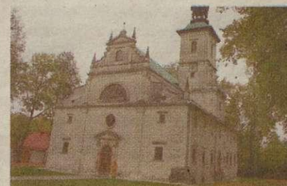
8. Rytwiany - Pustelnia Złotego Lasu i Gagaty Sołtykowskie