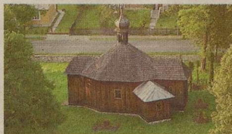
11. Bliżyn - kościół Świętej Zofii