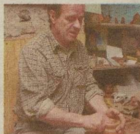
6. Chatupki - Ośrodek Tradycji Garncarstwa