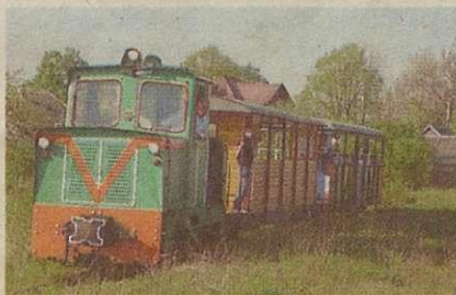
5. Starachowicka Kolej Wąskotorowa