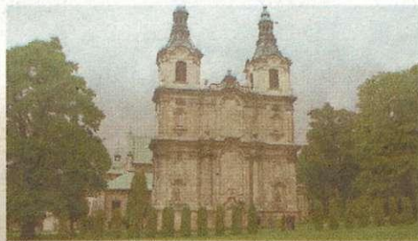
2. Jędrzejów - opactwo Cystersów