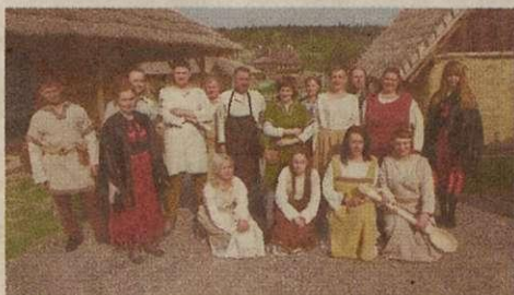
9. Huta Szklana - Osada Średniowieczna