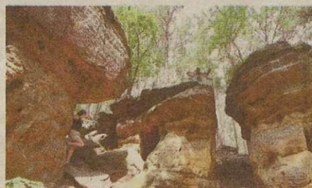
7. Niekłań - Skałki Piekło pod Niekłańmiem