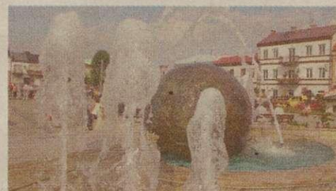
12. Chmielnik - Rynek